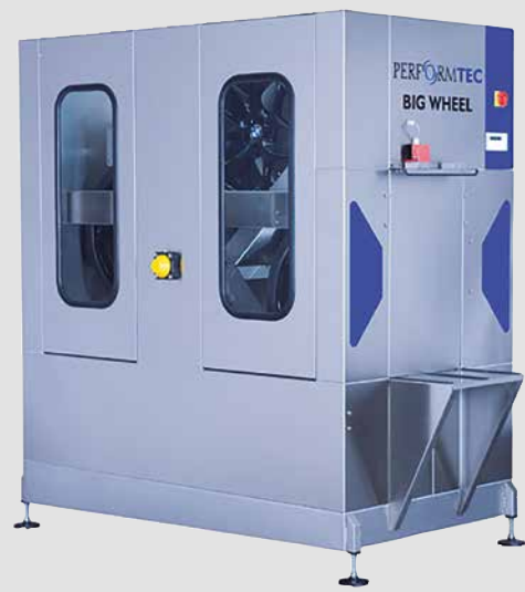
4 Rad Waschanlage