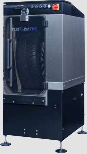
Modulare Waschanlage (Black Edition)